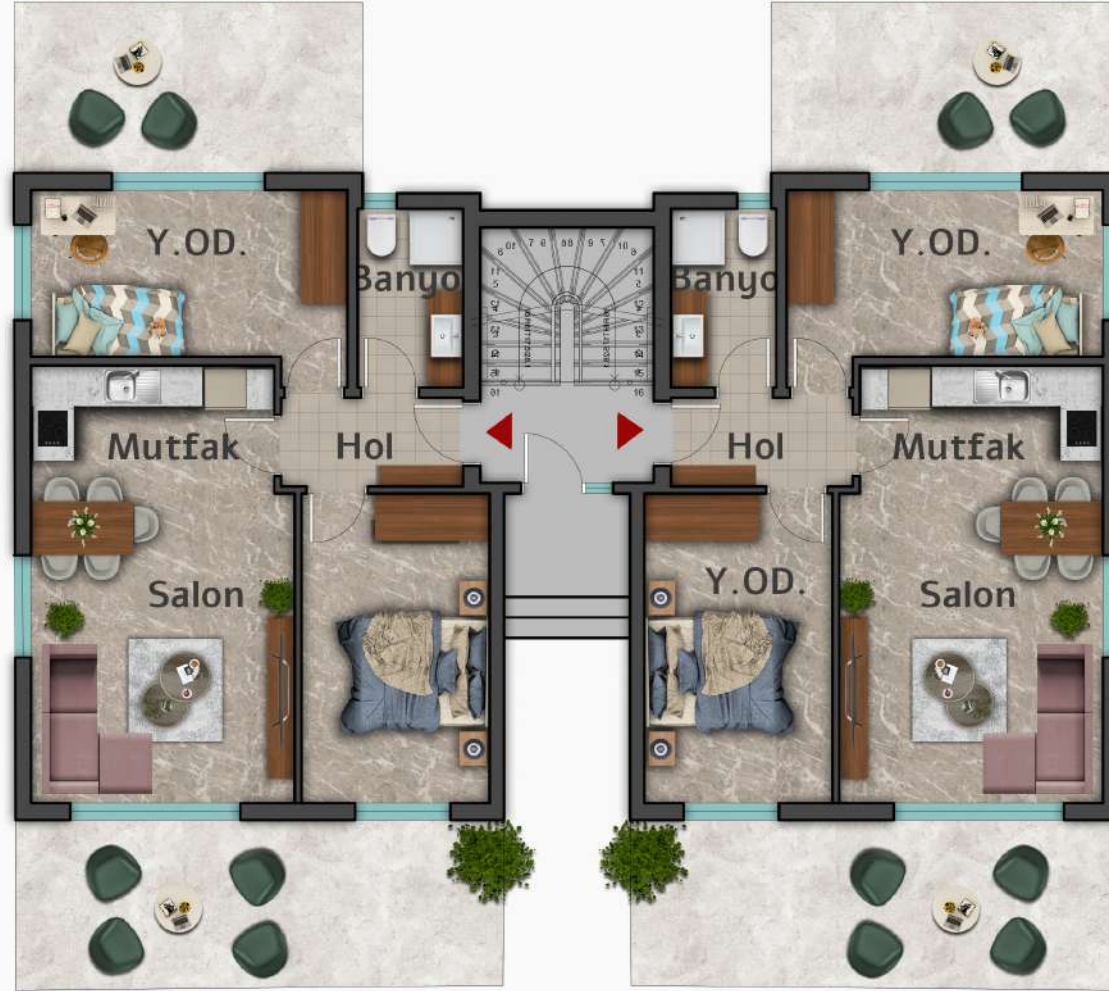
Maslina Residence A-B-C-D Blok Zemin Kat Planı