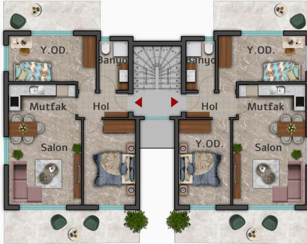
Maslina Residence A-B-C-D Blok Birinci Kat Planı